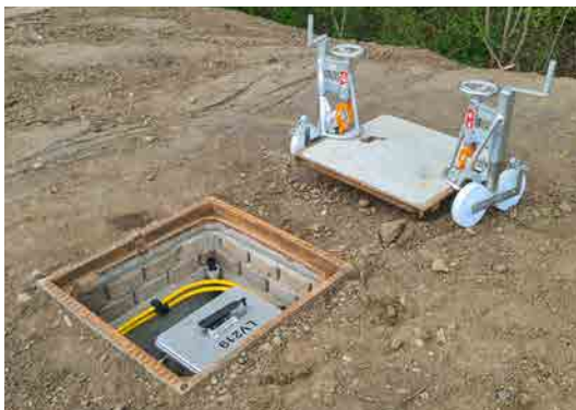
am Rand einer Landstraße, im Messbetrieb