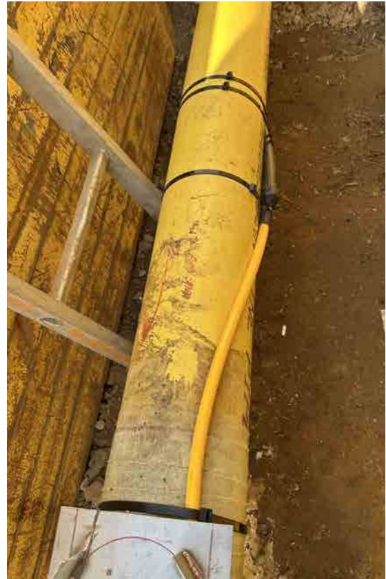
Konfektionierter Umkehrpunkt auf Rohrleitung