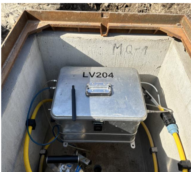
Anschluss, eine Messlinie