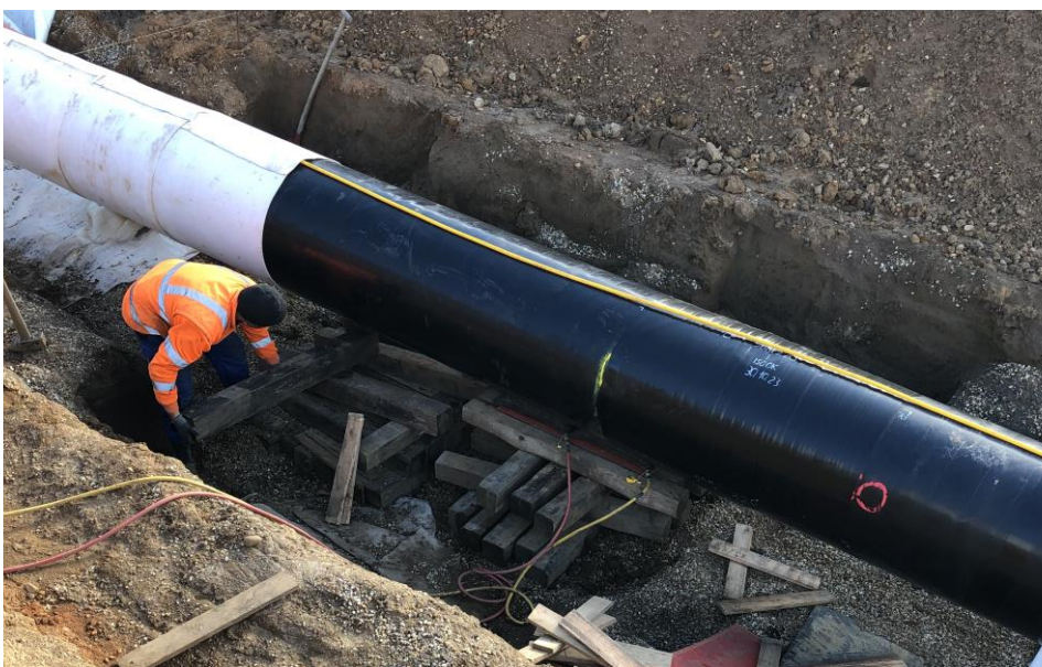
Montage der Messschläuche auf Gasleitungen