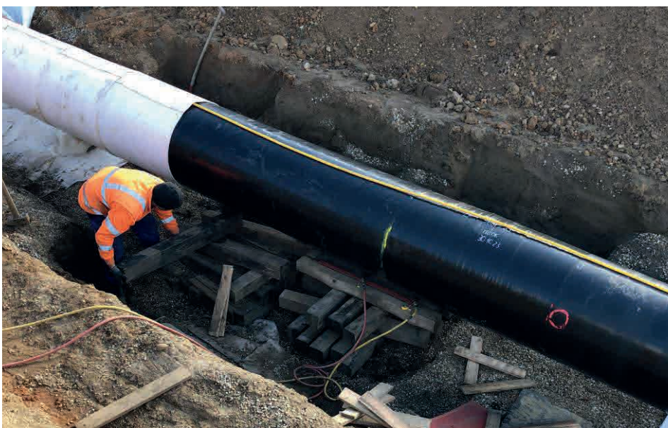
Montage der Messschläuche auf Gasleitungen