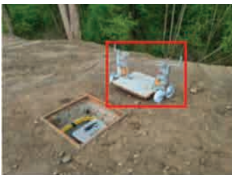
am Rand einer Landstraße, im Messbetrieb