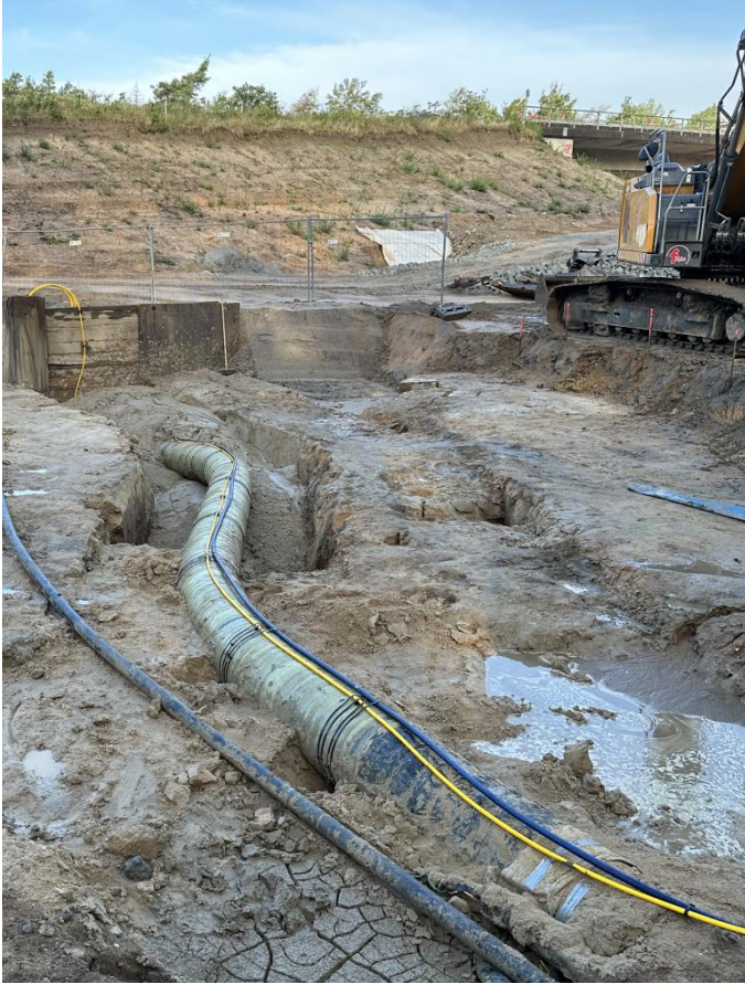
Befestigung L+P Mess-Schlauch und Temperaturmess-Leerrohr