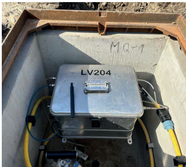
Anschluss, eine Messlinie