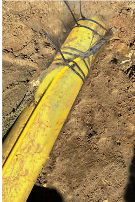
Konfektionierter Umkehrpunkt auf Rohrleitung