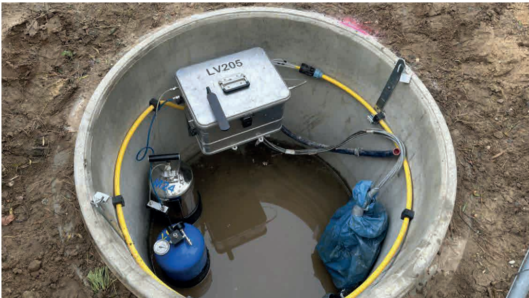
DN1200 – für Anschluss einer Messlinie