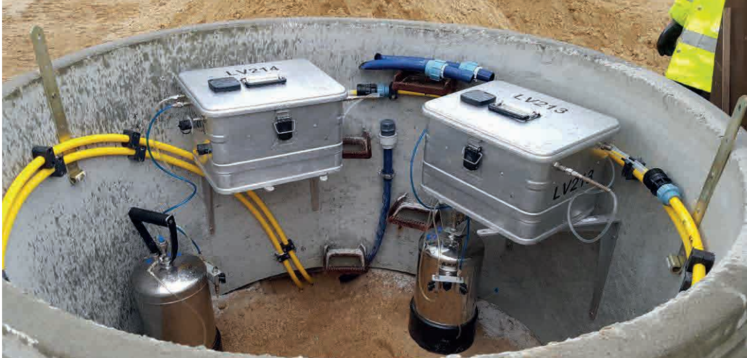
DN1500 – für Anschluss zweier Messlinien